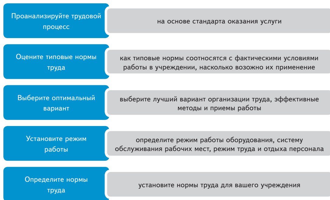
Схема. Что нужно сделать перед введением системы нормирования труда

Перед тем, как разработать и утвердить систему нормирования, нужно выполнить несколько действий (п. 17 Рекомендаций). Что именно сделать, посмотрите на схеме.