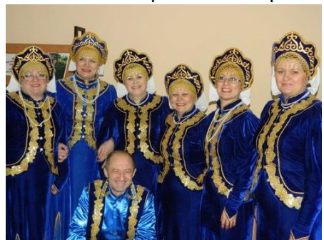
Народный вокальный ансамбль Надежда (руководитель Т. П. Звонарева) МАУК Культурно-досуговая система

Основное направление работы - стилизованная народная песня.