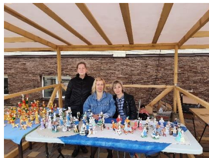
Студия лепки из глины Истоки (руководитель И.Д. Бежина) МАУК Культурно- досуговая система

В библиотеке реализуется проект «Интерактивный музей в библиотеке», целью которого является сохранение и возрождение традиционной народной культуры как основы развития культуры села, воспитание у подрастающего поколения чувства патриотизма, любви, гордости и причастности к малой родине. В библиотеку приходят не только жители села, но приезжают дети и взрослые из разных районов и городов Тульской области, других регионов России. Коллекция музейных предметов постоянно пополняется новыми поступлениями от жителей. С 1997 года в библиотеке работает детский клуб по интересам «Родничок», который объединяет тех, кто интересуется историей народной культуры, обрядами и традициями Тульского края.